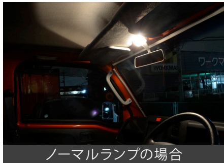
ノーマルランプの場合