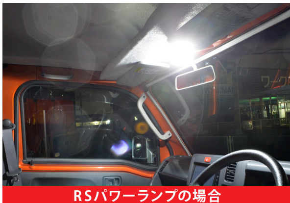
RSパワーランプの場合