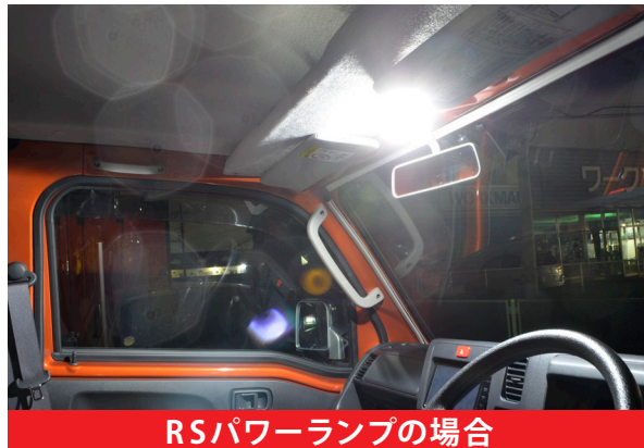
RSパワーランプの場合