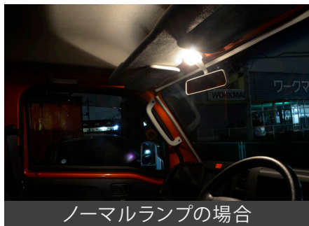
ノーマルランプの場合